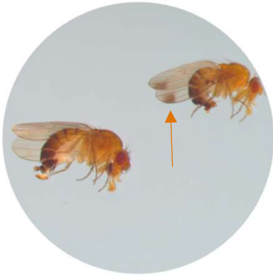
Koiralla täplät siivissä