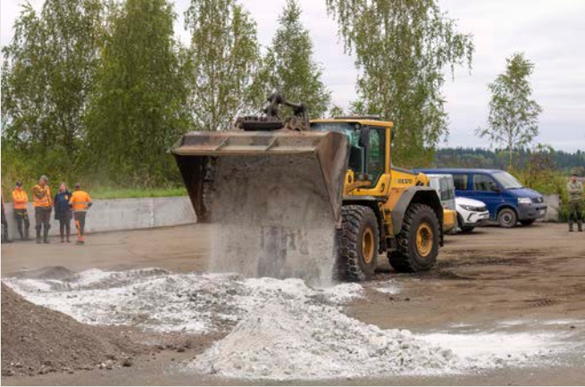
Kompostoitua ravinnekuitua ja kipsiä sekoitettiin tasaisella laatalta levitystä varten.

■ Luonnonvarakeskuksessa alkoi koe, jossa kipsiä sekoitetaan ravinnekuidun joukkoon ennen peltolevitystä. Kipsin on todettu vähentävän eroosiota ja fosforikuormitusta nopeasti peltolevi-