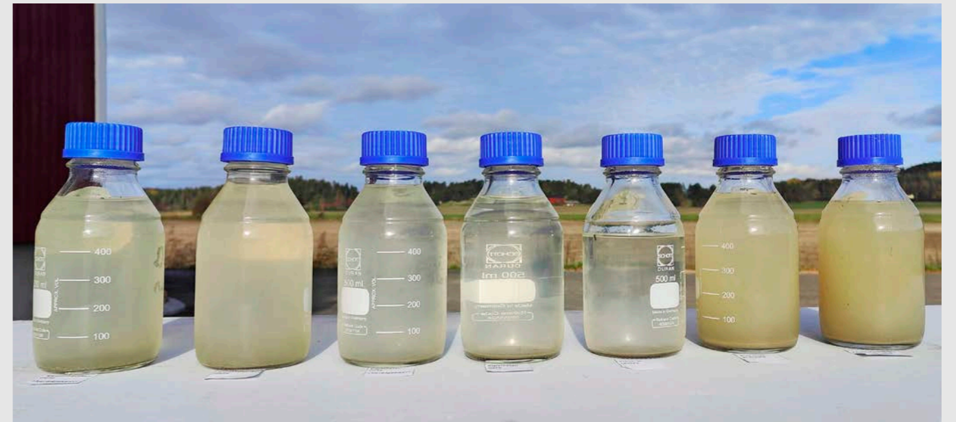
Sadesimulaation valumavesinäytteet vasemmalta oikealle, koeruudut 101, 102, 103, 104, 105, 106 ja 107. Viisi ensimmäistä vesinäytettä on koeruutujen monoliiteista, joille on levitetty kipsi. Ne ovat selkeästi kirkaampia kuin ilman kipsikäsittelyä jääneiden koeruutujen valumavedet.

Rakennekalkitus kasvattaa maan suolavahvuutta kuten kipsikäsittelykin. Siten näiden aineiden maan rakennetta vahvistava vaikutustapa on yhdenmukainen ja maan johtoluku on molemmilla aineilla sopivuusarvoinnin määräävin tekijä. Rakennekalkituksella ei oleteta olevan vaikutusta liukoisen fosforin huuhtoumaan, vaan toimintamekanismi on yksinomaan maan rakennetta vahvistava. Toimenpide onkin poissuljettu mailta, joilla savespitoisuus on liian vähäinen kestävän mururakenteen muodostumiselle.