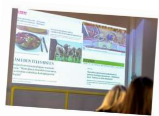
Kuumat perunat -keskustelussa purettiin ruokaan liittyviä vastakkainasetteluja ja toivottiin rohkeutta ruokajournalismiin